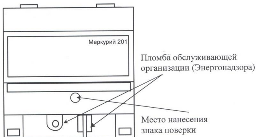
Рисунок 6 - Схема пломбировки от несанкционированного доступа, обозначение места нанесения знака поверки счётчиков «Меркурий 201.1», «Меркурий 201.2», «Меркурий 201.22», «Меркурий 201.3», «Меркурий 201.4», «Меркурий 201.42», «Меркурий 201.5», «Меркурий 201.6»